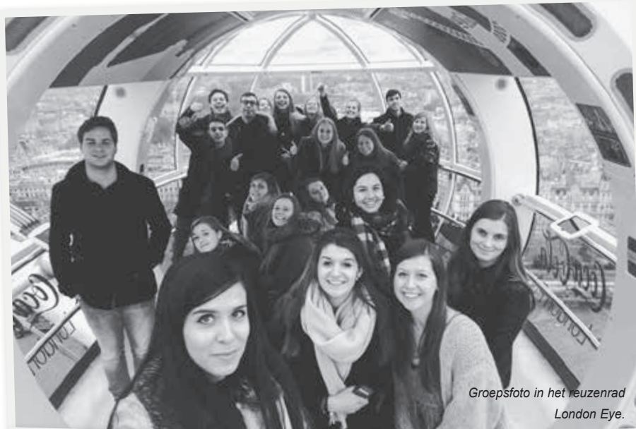
Groepsfoto in het reuzenrad London Eye.

warm gemaakt voor een LSE zomerprogramma of master na masteropleiding. De buitenkant van het Lloyd's of London gebouw is sowieso al indrukwekkend, maar eens binnen is het vooral de georganiseerde chaos van de verzekeringsmakelaars en de onderschrijvers die de studenten bijblijft. Ook in Londen horen we enkele