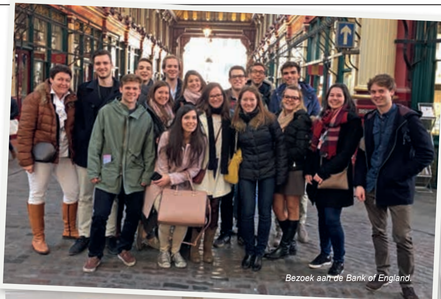
Bezoek aan de Bank of England.