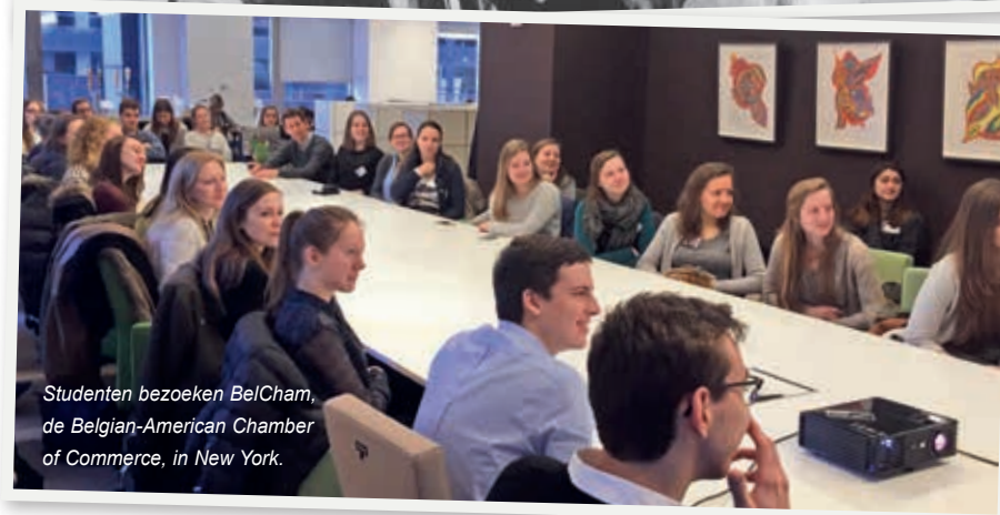
Studenten bezoeken BelCham, de Belgian-American Chamber of Commerce, in New York.